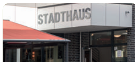
STADTHAUS in Herne-Mitte

Ein Einzug in unsere WGs ist unabhängig von Ihrer individuellen wirtschaftlichen Situation möglich. Gerne zeigen wir Ihnen, wie das Konzept unserer Senioren-WGs auch für Ihre persönliche Lebenssituation funktionieren kann. Vereinbaren Sie einfach einen unverbindlichen Beratungstermin.