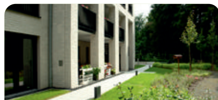
Albert-Schweitzer-Haus in Herne-Röhlinghausen